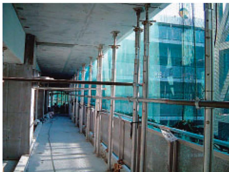
バルコニー取付例