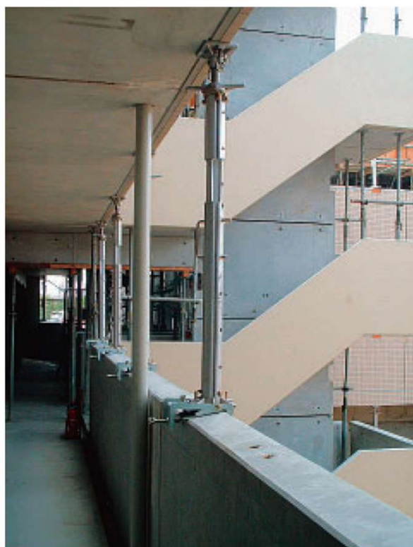
PCaバルコニー受け (PCベース併用)