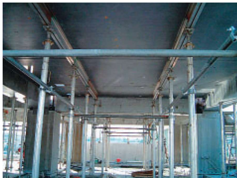
コンクリート製床板受け